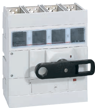
0 265 98