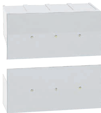
0 262 65