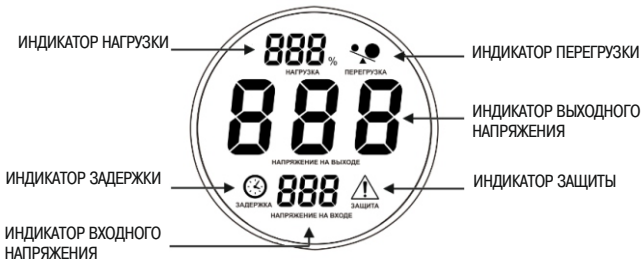
Рисунок 3 – Индикация режимов работы стабилизаторов

3.5 На передней панели корпуса стабилизатора расположен дисплей, отображающий режимы работы. Значение выходного напряжения отображается с точностью, указанной в таблице 2.